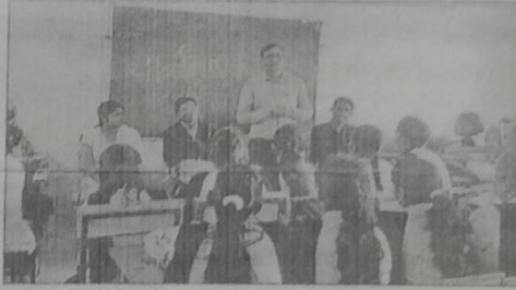
कालेज के विद्यार्थियों को दिव्यांगों के अधिकार के बारे में जानकारी दी गई।

दिव्यांगजनों को समाज में उनकी बराबरी विकास के लिए दिव्यांग व्यक्तियों के अधिकारों के बारे में लोगों को जागरूक करने के लिए सामान्य नागरिकों की तरह उनके सेहत पर ध्यान देने के लिए और उनकी सामाजिक आर्थिक स्थिति को सुधारने के लिए पूर्ण सहभागिता और समानता के थीम पर दिव्यांग व्यक्ति के लिए अंतर्राष्ट्रीय दिव्यांग दिवस मनाया गया। इस अवसर