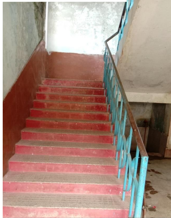
College Rd, Dongargaon, Chhattisgarh 491661, India Latitude 20.964022° Longitude 80.848593° LOCAL 03:41 PM THURSDAY 19.08.2021 GMT 10:11 AM ALTITUDE 336 METER