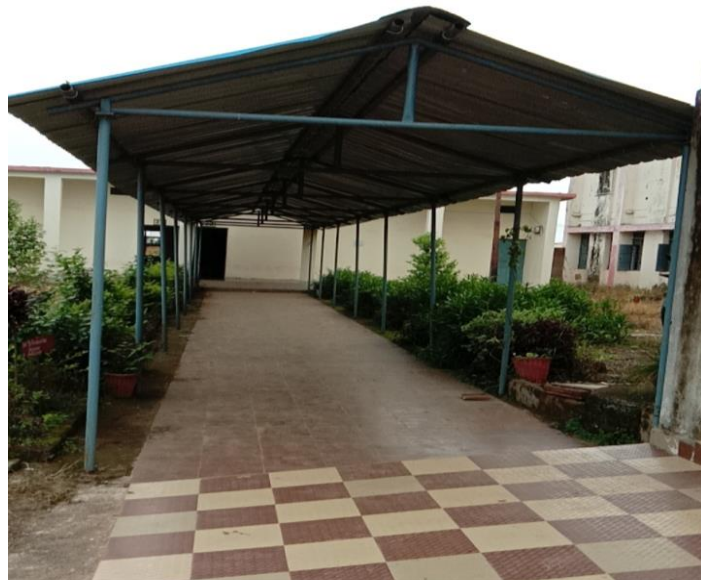
College Rd, Dongargaon, Chhattisgarh 491661, India Latitude 20.963780° Longitude 80.848559° LOCAL 03:42 PM THURSDAY 19.08.2021 GMT 10:12 AM ALTITUDE 336 METER